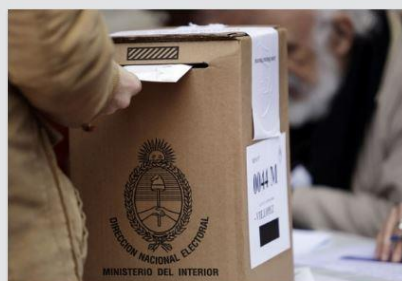
Elezioni in Argentina